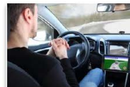
運転の自動(自律)化